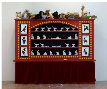
Mark Dion, The Shooting Gallery, 2010