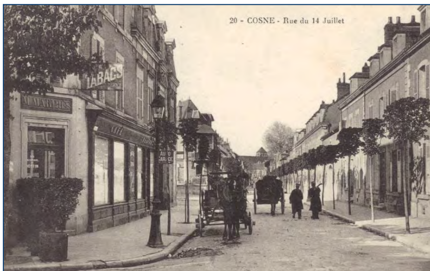
La rue du 14 juillet au début du 20 ème siècle

En 1890, un arrêté municipal nous indique que la Saint Michel se tenait sur les places d'Armes (8), de la Mairie et des Victoires (9) et dans la rue du 14 juillet, tout comme aujourd'hui.