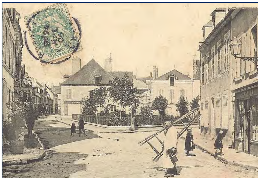
Le square Gambon au début du 20 ème siècle

Le marché aux oignons avait lieu rue de la Tour Froide (6). En 1865, « considérant que la circulation est gênée et interceptée... par les dépôts de sacs et la vente des oignons », le marché est transféré « sur la place de la prison rue des Augustins » (7)