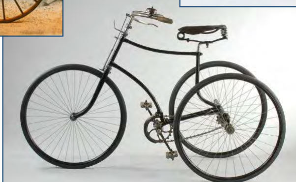
De gauche à droite : vélocipède, tricycle et bicyclette à la fin du 19 ème siècle