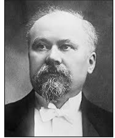
Raymond Poincaré Président de la République (1913-1920)

Né en 1860 à Bar-le-Duc, Raymond Poincaré entre très tôt en politique : député puis sénateur de la Meuse, ministre (Instruction publique, Beaux-arts et Cultes, Finances, Affaires étrangères), président du Conseil. Il est élu président de la République en 1913.