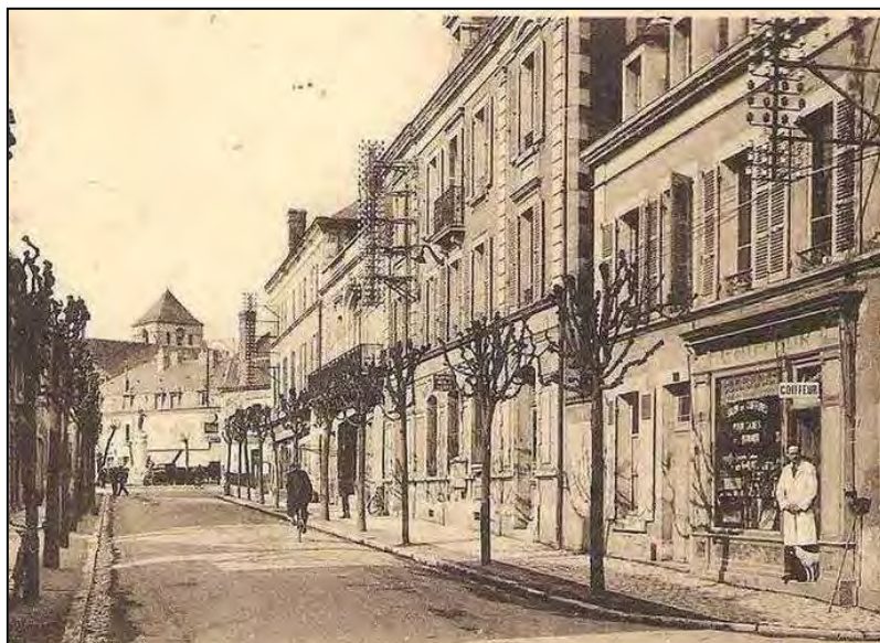
La poste, rue du 14 juillet (à gauche de l'immeuble du coiffeur)