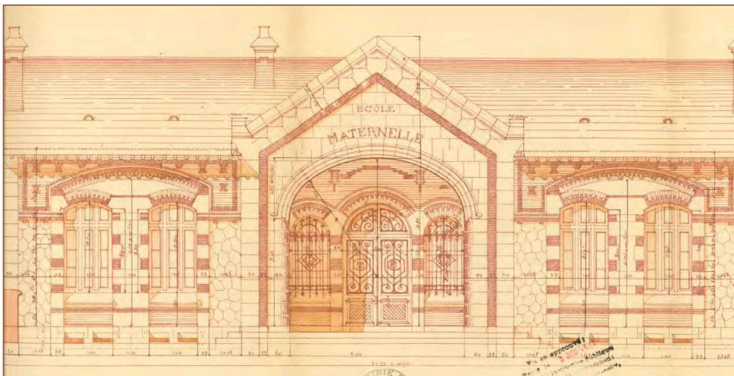
Projet de construction d'une école maternelle rue Caumeau