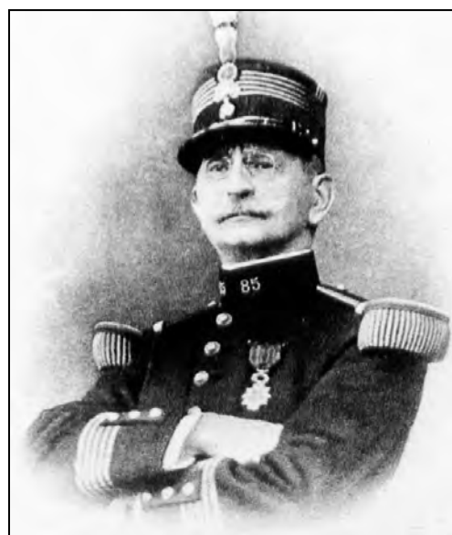
Le colonel Rabier