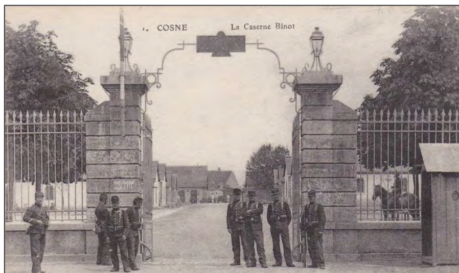
La caserne Binot

La population « comptée à part », soit 1547 personnes, se répartit ainsi : 1419 militaires à la caserne Binot, 4 détenus à la prison, 86 malades à l'hôpital civil et militaire et 38 élèves internes au collège.