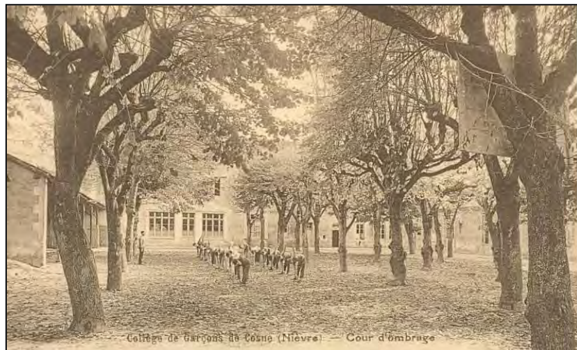
La cour du collège

Deux projets de construction voient le jour, qui seront finalement abandonnés :