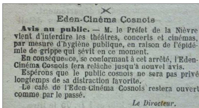
Journal de Cosne, 12 octobre et 30 novembre 1918

À l'automne 1918, une pandémie se répand dans toute l'Europe, provoquant des milliers de morts : la grippe espagnole. Les autorités prennent des mesures drastiques pour limiter les risques de contagion. Le préfet de la Nièvre décide « d'interdire momentanément tous groupements ou réunions non indispensables à la vie publique. » L'Eden cinéma est fermé pendant presque 2 mois.