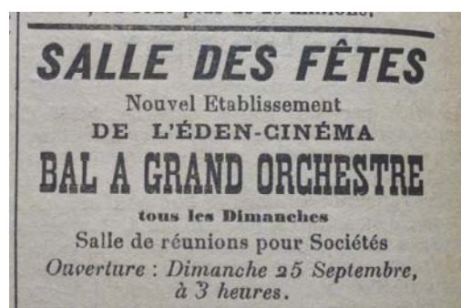
Journal de Cosne, 24 septembre 1921

Le 18 septembre 1921, M Pluviaux sollicite auprès de la municipalité « l'autorisation d'ouvrir un bal public qui se tiendra le dimanche de chaque semaine et les jours fériés, de 15h à 18h et de 20h à 24h. » Une salle de bal est construite en contrebas du cinéma, côté ouest (3). Elle ouvre ses portes à l'occasion des fêtes de la Saint-Michel, le dimanche 25 septembre 1921.