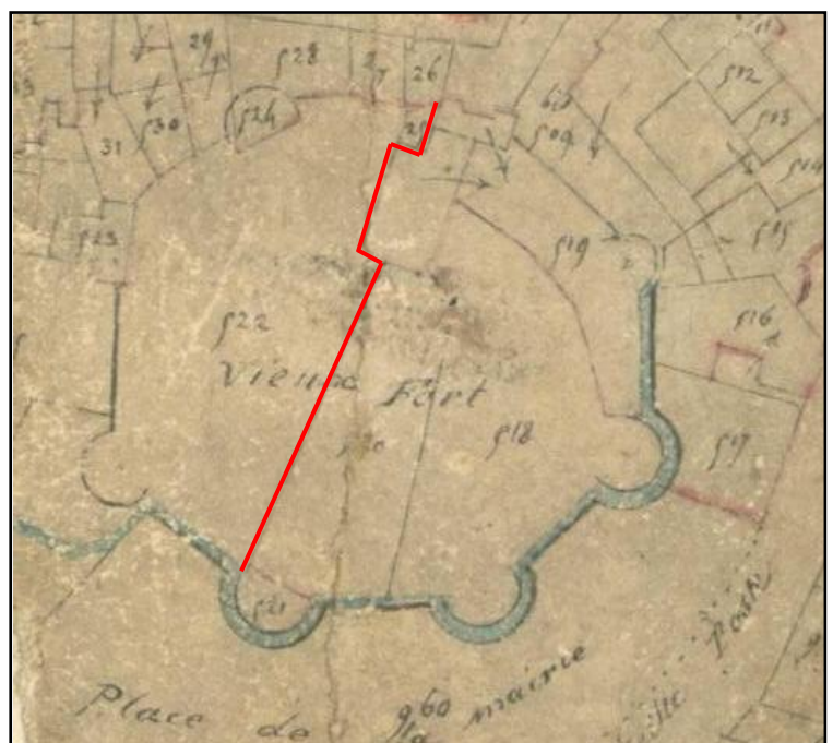
Détail du plan cadastral du centre ville, 1834