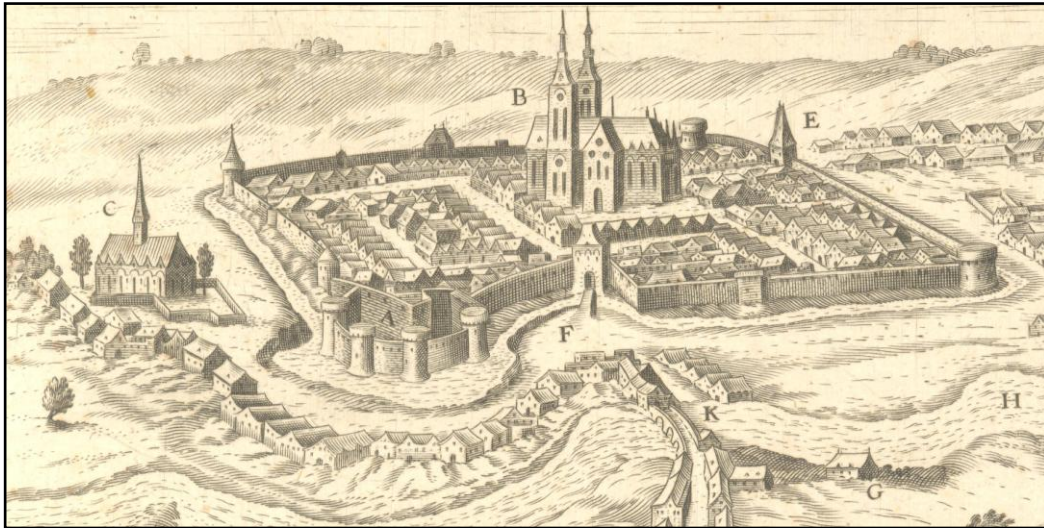
Le château de Cosne, détail d'une gravure de Chastillon, fin 16 ème -début 17 ème

En 1640, le duc de Richelieu fait araser les tours et les courtines (5). Le château tombe peu à peu dans l'abandon, les fossés sont comblés, des jardins et des constructions viennent s'adosser aux courtines, excepté du côté ouest.